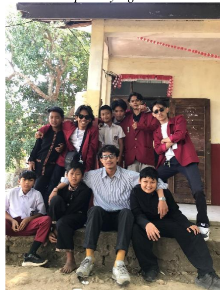
Gambar 4. Foto Bersama