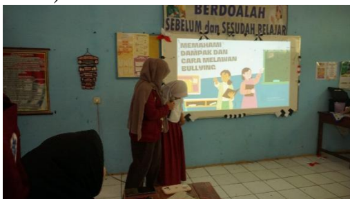
Gambar 2. Pemberian Reward Siswa

Saat sesi psikoedukasi berakhir, narasumber memberikan permainan untuk mengukur seberapa baik siswa memahami materi yang telah dijelaskan. Siswa yang menemukan jawaban yang benar akan diberi hadiah berupa cemilan sebagai penghargaan. (Gambar 2)