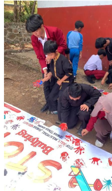
Gambar 3. Finger painting di banner “ Stop Bullying ”