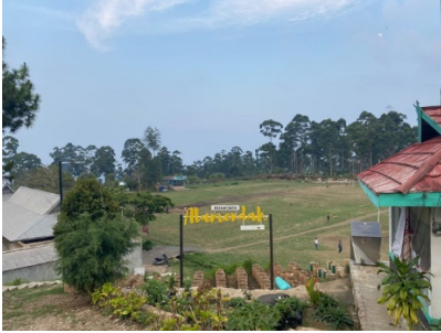
Gambar 1. Desa Wisata Alamendah

Gambar 1 menampilkan lokasi Desa Wisata Alamendah yang menjadi objek dalam penelitian ini. Secara geografis, desa tersebut berada di Kecamatan Rancabali, Kabupaten Bandung, Provinsi Jawa Barat. Penetapan Desa Alamendah sebagai desa wisata ditetapkan melalui Keputusan Bupati Bandung No. 556.42/Kep.71-Dispopar/2011 pada tanggal 2 Februari 2011. Pada tahap awal pengembangannya, Desa Wisata Alamendah (disingkat Dawala ) belum memiliki produk maupun paket wisata yang terstruktur untuk ditawarkan kepada wisatawan, sehingga tingkat kunjungan masih relatif rendah. Namun, sejak tahun 2019, pengelola mulai berfokus pada pengembangan inovasi produk dan penyusunan paket wisata dengan memanfaatkan potensi lokal yang dimiliki desa, seperti sektor pertanian, budaya, serta kearifan lokal masyarakat. Upaya ini menjadi titik awal kebangkitan Desa Alamendah sebagai destinasi wisata berbasis komunitas yang berorientasi pada keberlanjutan.